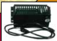
Ventilateur / Blower

Grande chambre à combustion / Large firebox