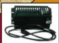
Ventilateur / Blower

Grande chambre à combustion / Large firebox