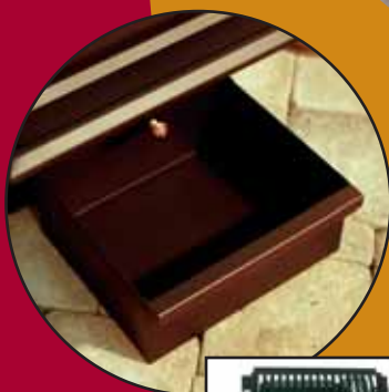
Tiroir à cendre Ash pan