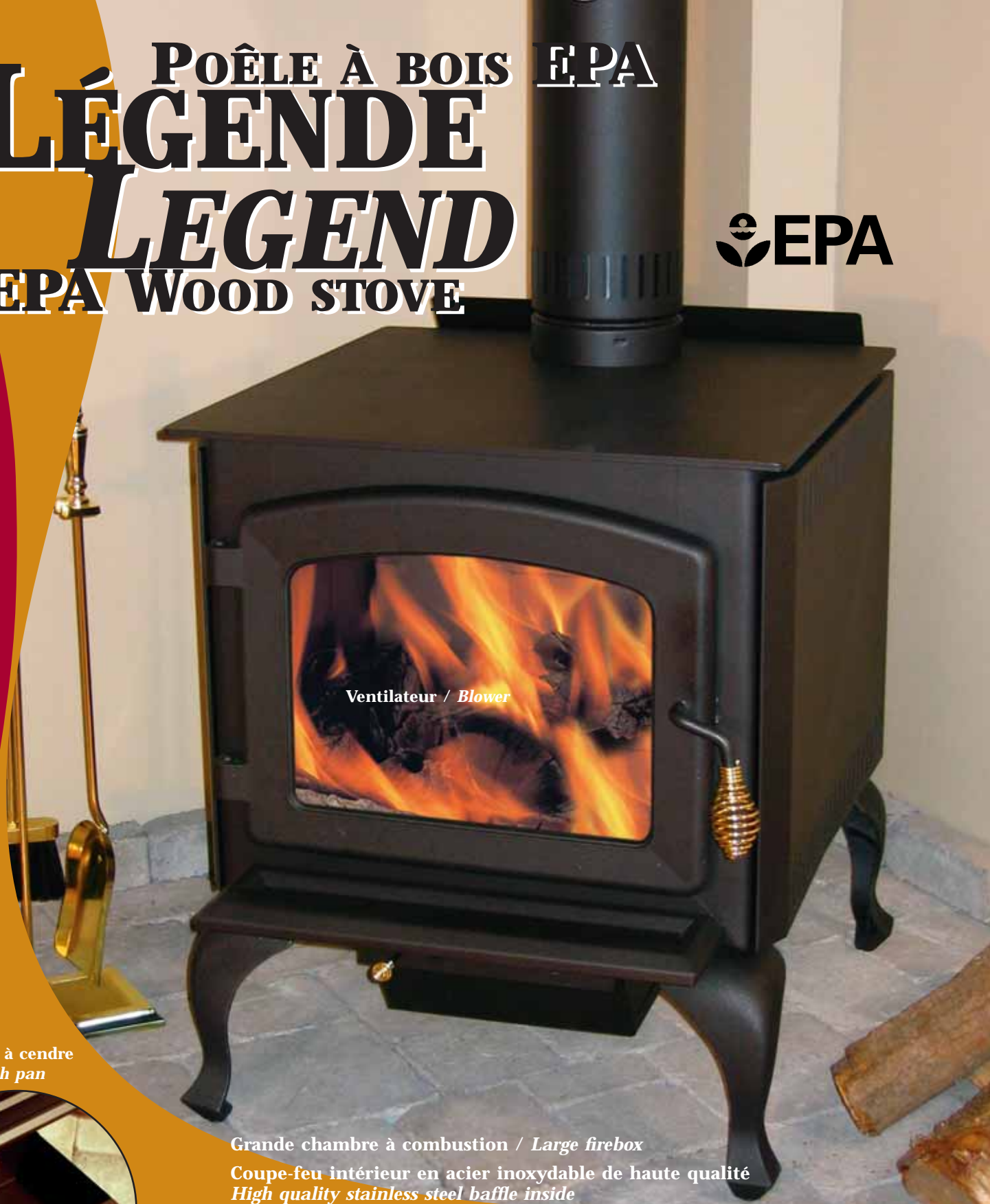
Ventilateur / Blower